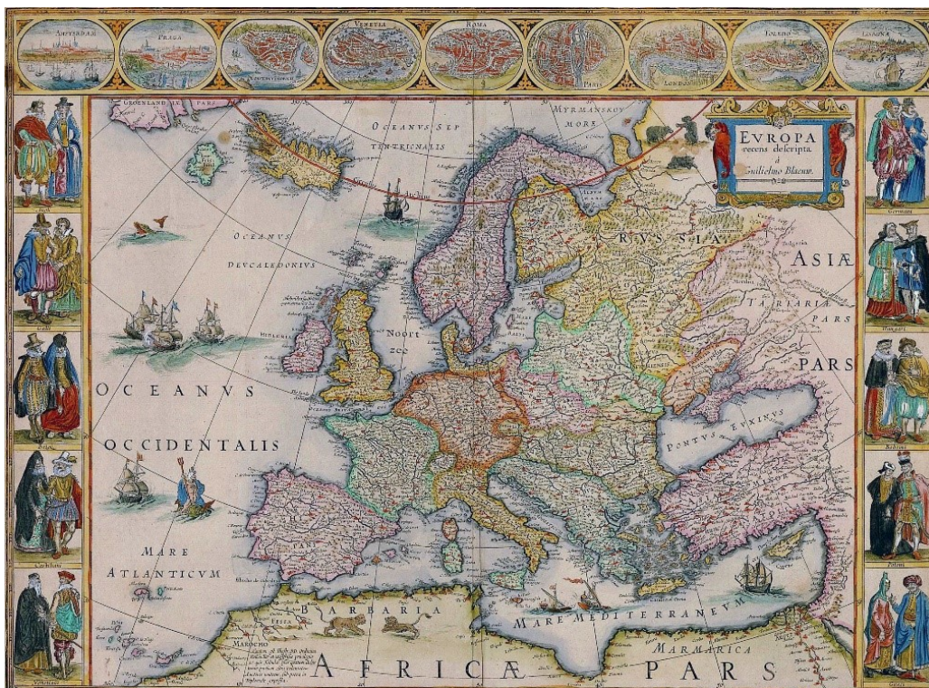
Willem Blaeu: Europa recens descripta, Amsterdam ± 1640

De jaarlijkse Open Monumentendagen vinden in Nederland plaats op zaterdag 8 en zondag 9 september. Aansluitend bij het Europese Jaar van het Cultureel Erfgoed is het thema in 2018: In Europa. De geschiedenis van de Staats-Spaanse Linies is bij uitstek een Europees verhaal. De Linies vinden hun oorsprong in de 16 de /17 de eeuw, de tijd waarin de Nederlanden in opstand kwamen tegen het Spaanse gezag. Regelmatig versterkt en uitgebreid deden de verdedigingswerken dienst tot aan de Franse invasies in de 18 de eeuw, eerst tijdens de Oostenrijkse successieoorlog en aan het eind van de eeuw tegen de troepen van Napoleon. Tot op de dag van vandaag wordt het landschap van de grensstreek voor een belangrijk deel bepaald door de Staats-Spaanse Linies.