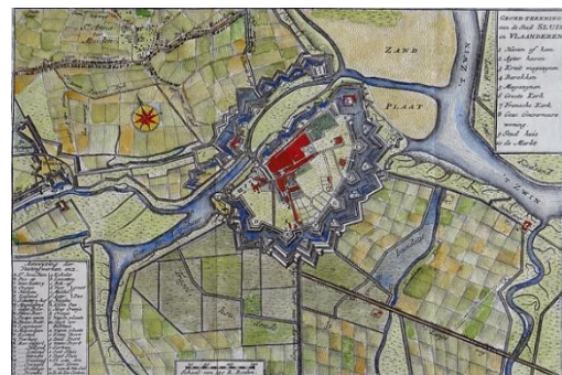
Grond-tekening van de stad Sluis, I. Tirion, 1745