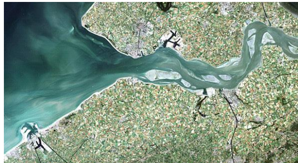
West-Zeeuws-Vlaanderen